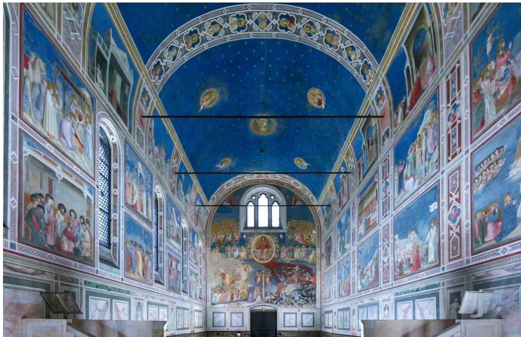
- cycle de peintures de Giotto au sein de la chapelle des Scrovegni-