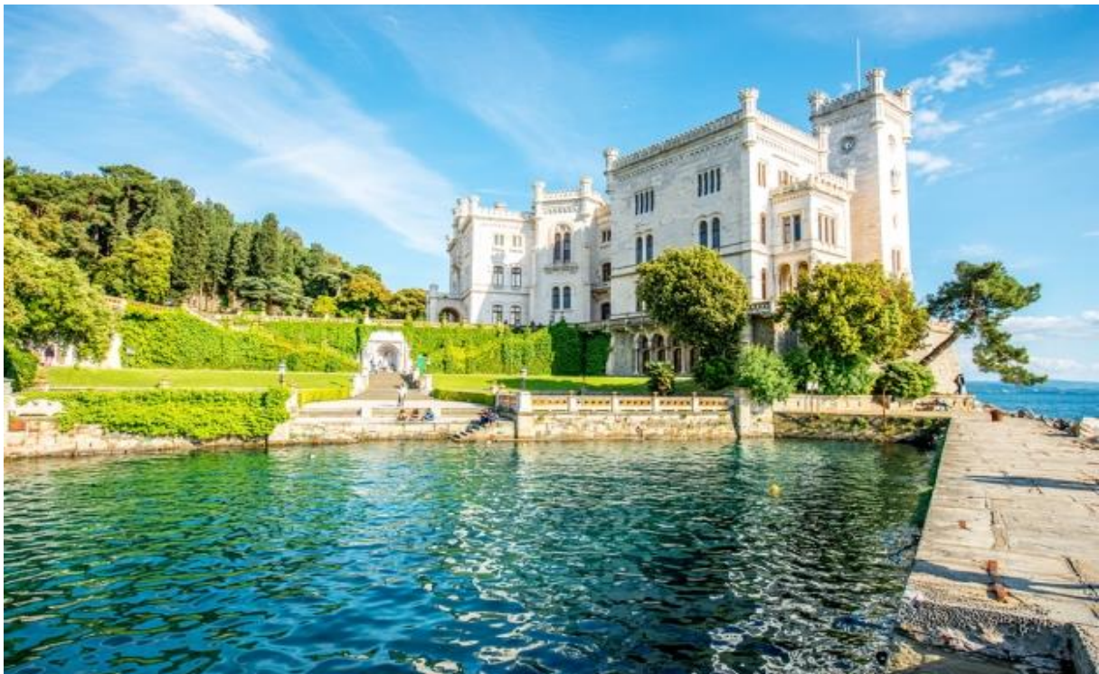
- Château de Miramare-

Se munir de sa carte européenne d'assurance maladie (CEAM).